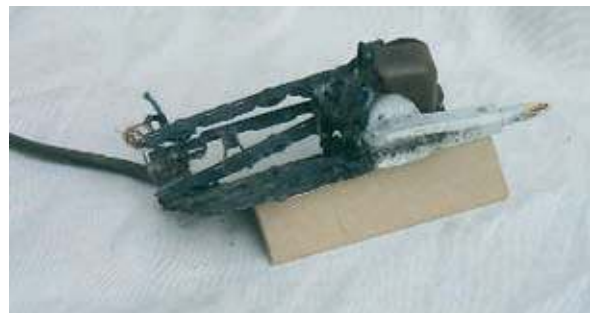
Diese überlastete Tischsteckdose verursachte einen Küchenbrand

Sie müssen zwecks Vermeidung von Wärmestau „offen“ sprich zugänglich betrieben werden, so dass entstehende Wärme abgeführt wird.